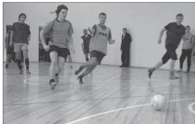
за Кубок турнира по мини-футболу борются команды казахской, татарской, алтайской, бурятской национально-культурных автономий