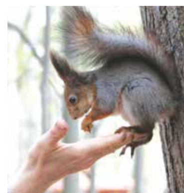
Белки в Лагерном саду совсем ручные