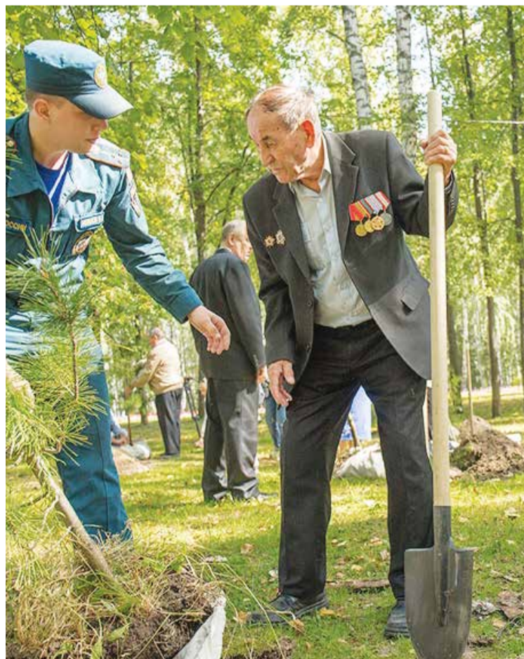
Томичи постоянно подсаживают новые деревья в парке

То, что Лагерный сад лучше всякого психотерапевта просветляет душу и гонит