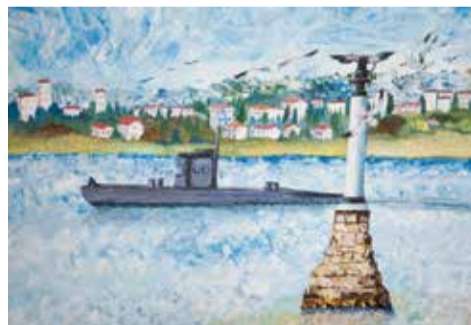
Рисунок Саша Бородина

«Война за океан» отражают героизм и повседневную службу на благо Отечества подводников Военно-морского флота России.