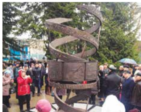
Памятник «250 лет служения России» – дань памяти всем российским немцам, волею судеб оказавшимся в Сибири, пережившим вместе с Россией все горестные и радостные события в своей жизни