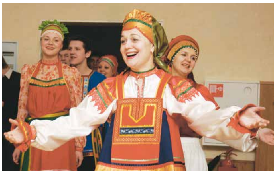
Томские белорусы – народ веселый, голосистый и жизнерадостный