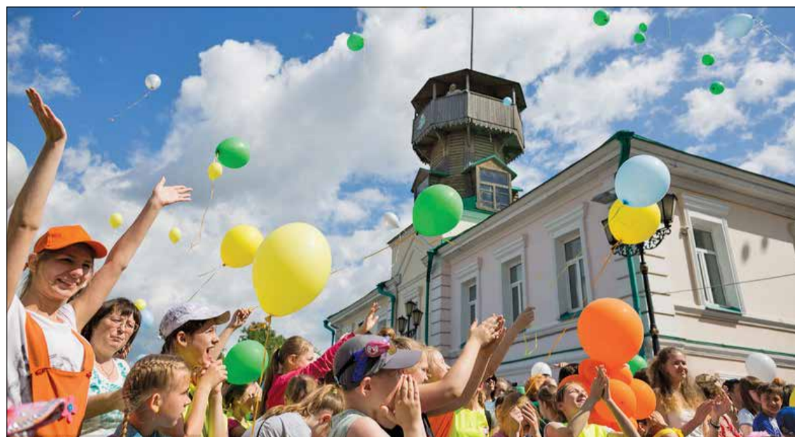
На Воскресенской горе главными действующими лицами стали дети. Среди них – юные горожане, отметившие 7 июня собственный день рождения

никам, чтобы все их мечты и желания сбывались. И всем вместе – «любить город, быть патриотами, любить и сохранять дух старинного, но вечного молодого Томска. А для того, чтобы все это сохранить и приумножить, надо много учиться и работать».