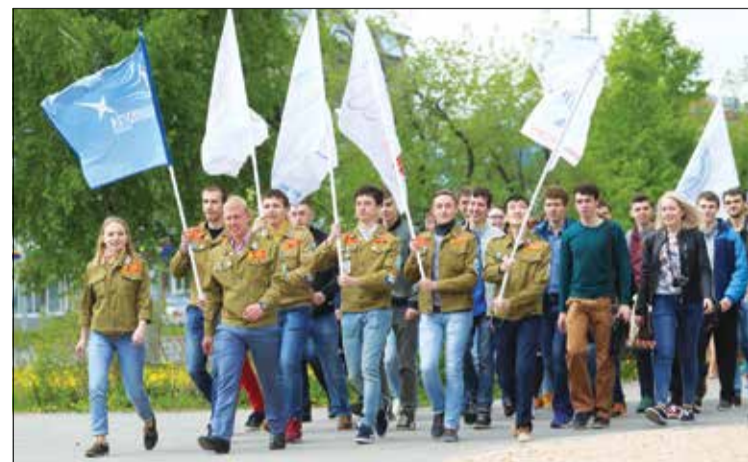
В трудовое лето бойцы томских ССО шагнули с оптимизмом и верой в свои силы