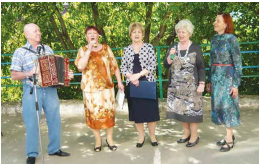
В доме на ул. Профсоюзной, 16/2, живут талантливые люди, которые давно стали добрыми соседями

– Мы уже пять лет подряд всем домом проводим и весенне-осенние субботники по наведению порядка, и детские праздники, посвященные конкурсу «Томский дворик», и встречаем Новый год во дворе. Но Дня соседей у нас еще не было. О нем мы узнали от сотрудников отдела ТОС администрации Ленинского района, которые оказали нам огромную помощь в организации праздника. Совместно с домом детского творчества «Планета» мы разработали сценарий, администрация района, депутаты, управляющая компания «Мастер» и жители дома помогли с подарками, минеральной водой, сладостями, выпечкой и прочими атрибутами праздника.