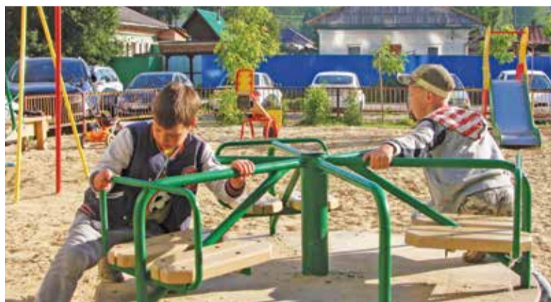
На детской площадке всегда весело

роткая, и жильцы дома решили для своих ребятишек создать детский центр. Квартиры в доме малогабаритные, и даже день рождения ребенка отпраздновать в компании с такими же шалунами – проблема. Дошкольников же в доме больше пятидесяти, много первоклашек.