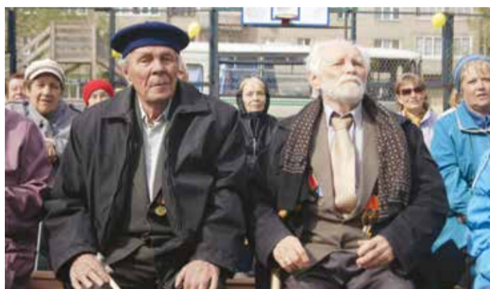
Ветераны дома на ул. Нахимова, 15, на празднике в честь Дня старшего поколения

торые он возглавляет ТСЖ «Университетское», прошел через несколько судов, но сумел взыскать многолетние долги с собственников нежилых помещений. А их в доме, между прочим, 12. Десять из них вступили в ТСЖ и платят за ЖКУ так же, как и остальные собственники квартир, подчиняются общим для всех жильцов правилам: оплачивают капремонт, лифт, текущий ремонт и прочие расходы. И хотя узлы управления теплоснабжением по-прежнему на их территории, доступ специалистов ТСЖ к ним обеспечен.