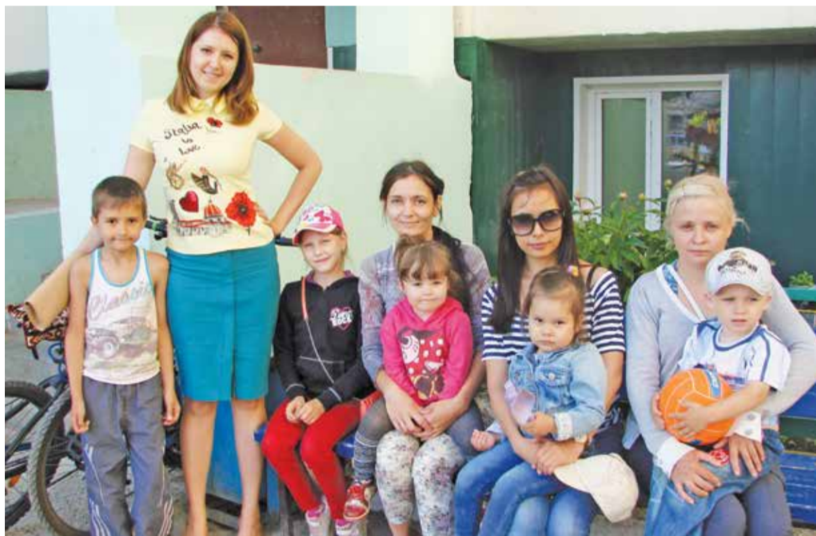
Интересные идеи по содержанию дома порой рождаются в разговоре на лавочке

Кстати, о клубе. Теплая и солнечная пора в Сибири ко-