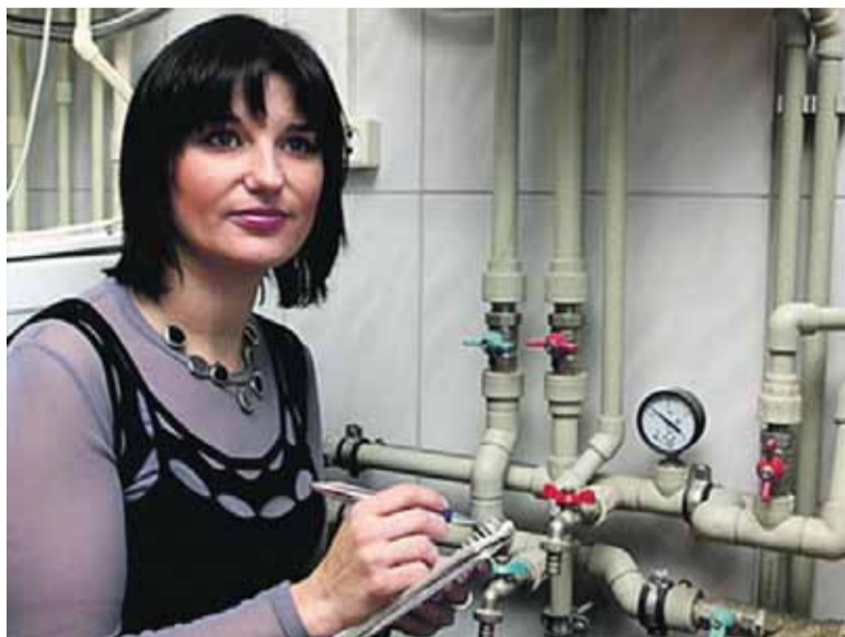
Задача городской власти – помогать советам домов, чтобы они имели возможность выполнять свои задачи и функции

В администрации Томска есть понимание, что в тех домах, где жители пассивны, может ничего не делаться годами. И наоборот. Однако