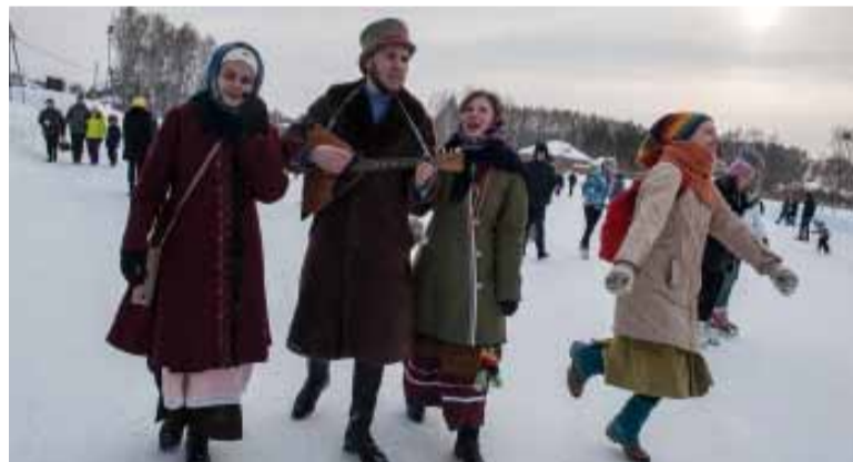
Помимо гастрономического разнообразия на масленичных ярмарках были в изобилии представлены народные забавы

Ведь, как известно, Масленица – это не только состязания в поедании блинов, пусть даже и на скорость. Это еще и соревнования в ловкости и силе. Веками складывались традиции уличных масленичных забав – бег в мешках, перетягивание каната, покорение масленичного столба с подарками, рукопашный бой, упражнения с гирями, бой подушками, метание валенок и метелок... И, конечно, песни, хоромы, пляски