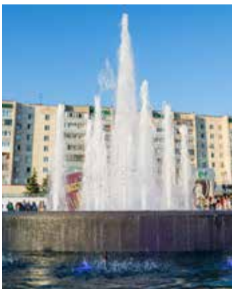
В День города Фонтан молодости пел песни о Томске