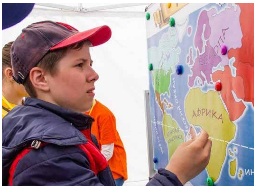
Занятие по душе на мероприятиях в честь Дня защиты детей могли найти себе все желающие